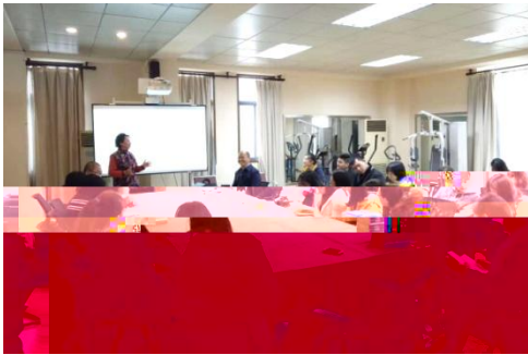
人文学院举办新书首发、捐赠与座谈会