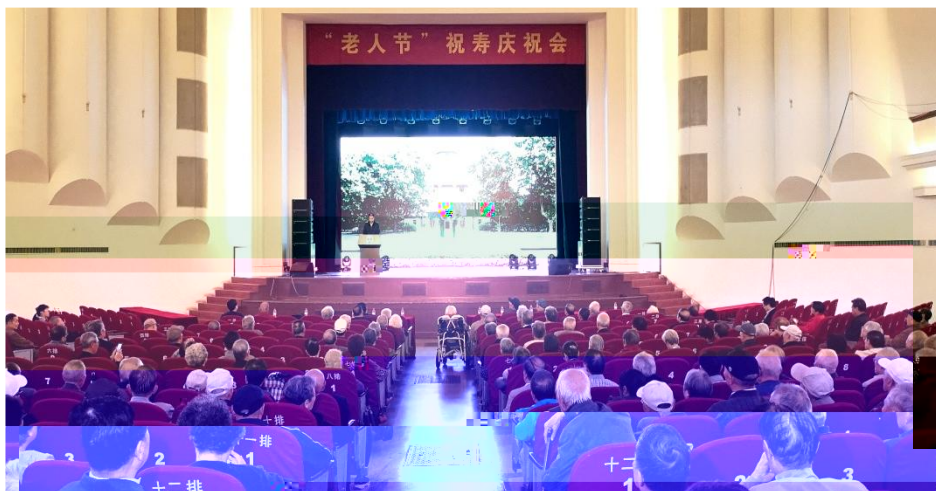
『老人节』祝寿会现场