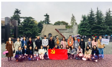
参加活动人员合影

为铭记历史，缅怀逝者，11月7日上午9时，老干部处党支部和东南大学公共卫生学院研究生第一党支部及高校关工委的老师，一同参观了侵华日军南京大屠杀遇难同胞纪念馆。