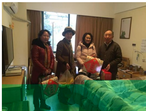
老干部处慰问老同志